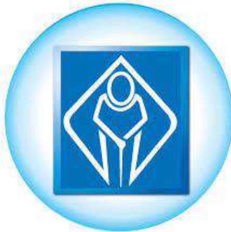
สัญลักษณ์ผู้สูงอายุ